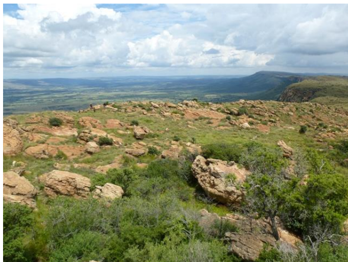
Foto: Hrebeň Magaliesberg

Aj na hrebeni su miesta, kde sa Buri ukryvali pred utokmi Britov, napr. Bomb Shelter alebo Fort Rock. Na jednu takuto plochu skalu som si lahol, pozoroval som pohybujuce sa mraky a citil som sa dobre. Bol som tam siroko daleko osamoteny, nechcelo sa mi odtial odist. Avšak čas neúprosne plynul, tak som sa musel vydať na spiatočnú cestu. Pokracoval som cestou späť po hrebeni a potom dole svahom. Urobil som vela fotiek aj videi. Na poslednom useku pred taborom, v hustejších krovinach, som si zrazu nebol isty, ci som na spravnej ceste. Aj som sa hodny usek vrátil, az som dokonca volal do Base Campu, aby som sa zorientoval. Stretol som vsak skupinu chlapikov (bielych) hrajucich miestnu formu golfu, nieco ako cricket, a ti mi potvrdili ze som na dobrej ceste.