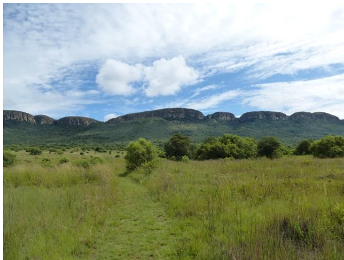
Foto: Magaliesberg Mountain Range

Aj na hrebeni su miesta, kde sa Buri ukryvali pred utokmi Britov, napr. Bomb Shelter alebo Fort Rock. Na jednu takuto plochu skalu som si lahol, pozoroval som pohybujuce sa mraky a citil som sa dobre. Bol som tam siroko daleko osamoteny, nechcelo sa mi odtial odist. Avšak čas neúprosne plynul, tak som sa musel vydať na spiatočnú cestu. Pokracoval som cestou späť po hrebeni a potom dole svahom. Urobil som vela fotiek aj videi. Na poslednom useku pred taborom, v hustejších krovinach, som si zrazu nebol isty, ci som na spravnej ceste. Aj som sa hodny usek vrátil, az som dokonca volal do Base Campu, aby som sa zorientoval. Stretol som vsak skupinu chlapikov (bielych) hrajucich miestnu formu golfu, nieco ako cricket, a ti mi potvrdili ze som na dobrej ceste.