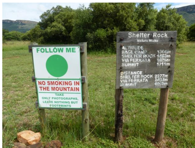
Foto: Start trasy