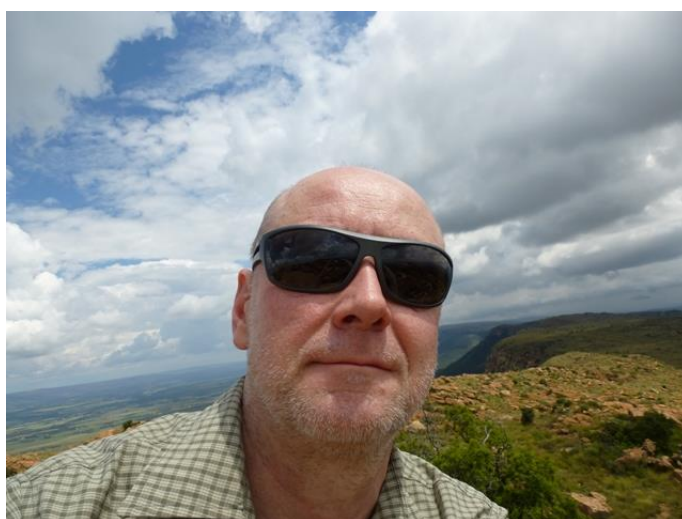
Foto: Na vrchole

Vtedy dorazili aj moji piati spoluputnici, ešte som ich usmernil, aby určite išli dalej a nevynechali Rock Garden, ze tam je to najkrajšie.