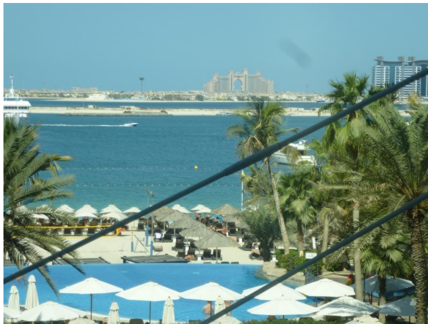
Foto: Dubaj, pohľad z hotela LeMeridien Mina Seyahi smerom na Palm Jumeirah s hotelom Atlantis v pozadi

Takze som strivil jednu noc a jeden den v kazdej z troch krajín, spolu styri dni aj s cestou a preletmi.