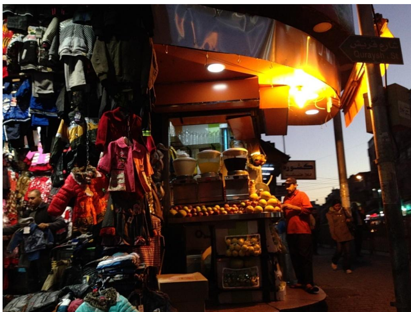
Foto: Vecerna ulica v centre Ammanu

Dalsia cesta do oblasti Blízkeho východu a Zálivu sa uskutočnila koncom októbra 2014. Na programe Ammán, Doha a Dubaj. Priletel dom do Ammánu s Austrian v pondelok poobede. Spolu s kolegom z Dubaja sme si isli podvečer pozrieť stare mesto. Odviezol nas miestny kolega v cerstvo havarovanom aute, z ktoreho visel zadny naraznik a vyfukove plyny prenikali do kabiny. Nevadi, videli sme kusok stareho mesta s rymským amfiteatrom. Aspon to, lebo na druhy den poobede sme uz prelietali do Dohy a v Ammane sme uz nic ine nevideli.