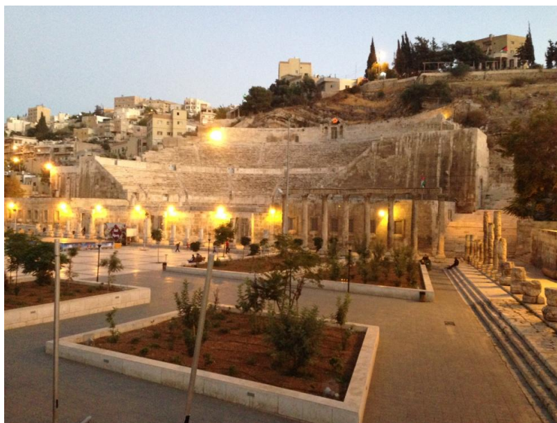
Foto: Upravene okolie rymseho amfiteatra