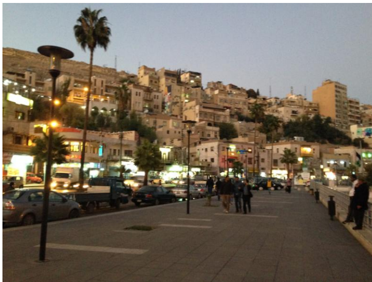
Foto: V starom centre Ammanu

Zaujimave je, ze povodni domorodi Jordanci tvoria mensinu obyvateľstva. Vacsinu obyvateľstva tvoria pristahovalci z Egypta a tiez Palestinci. Aspon tak nam to tvrdil miestny kolega.