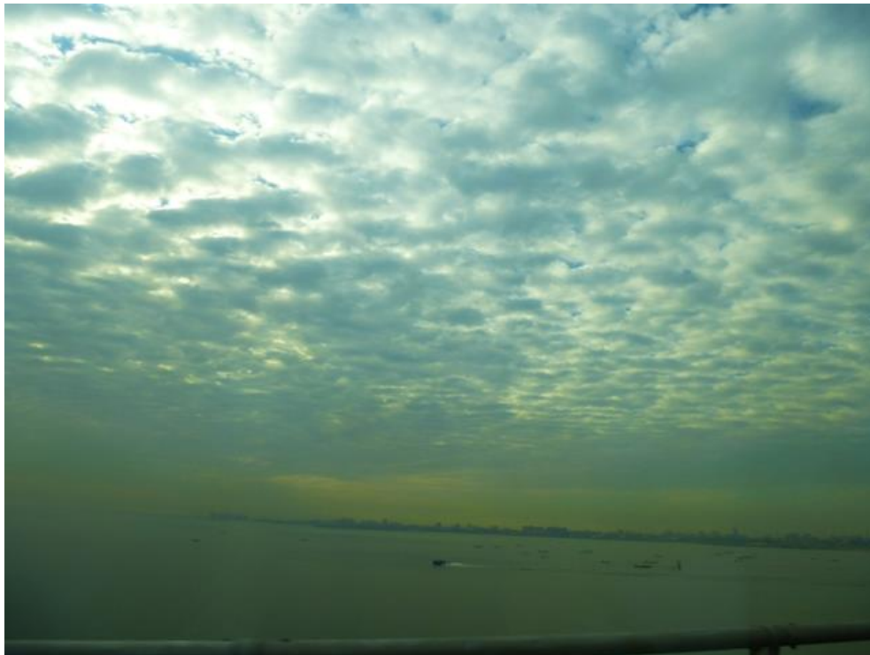
Foto: Rybarske lodky rano na lagune pri Victoria Island

Moj „Immigration Officer“ ma po prilete uz cakal a previedol cez uskalia byrokratickej a korupcnej masinerie na letisku. Cesta taxikom do hotela, tentoraz vsak nie Sheraton v Ikeja, ale Radisson Blu na Victoria Island (VI). Nocny drink v hotelovom bare. Lepsi hotel, lepsia stvrt, ale trosku od ruky. Nastastie rano smerovala hlavna dopravná spicka opacnym smerom. Ludia pracujuci na Victoria Island byvaju v iných stvrtiach. Inak na VI vedie z pevniny udajne najdlhsi most v Afrike. Je z neho dobry vyhlad na lagunu, rybarske osady na brehu, rybarske clny na mori a aj na slumy, ktore su okolo mosta na pobrezi.