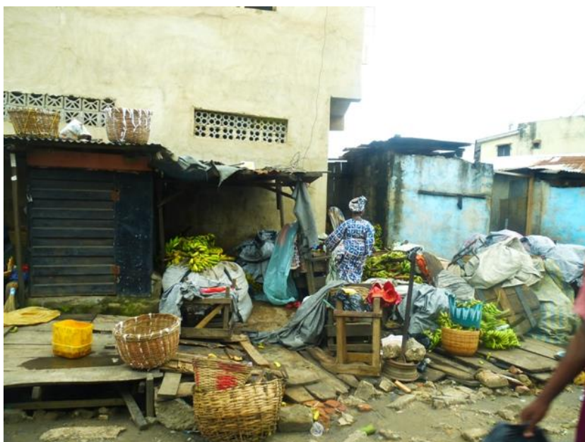
Foto: Život uliciach Lagosu