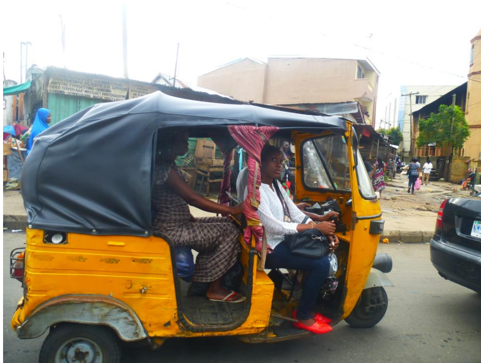
Foto: Jedna z foriem mestskej hromadnej dopravy v Lagose