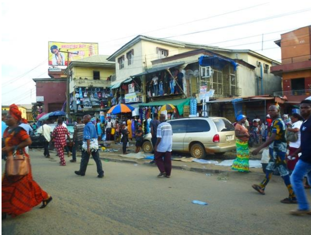
Foto: Ruch v uliciach Lagosu