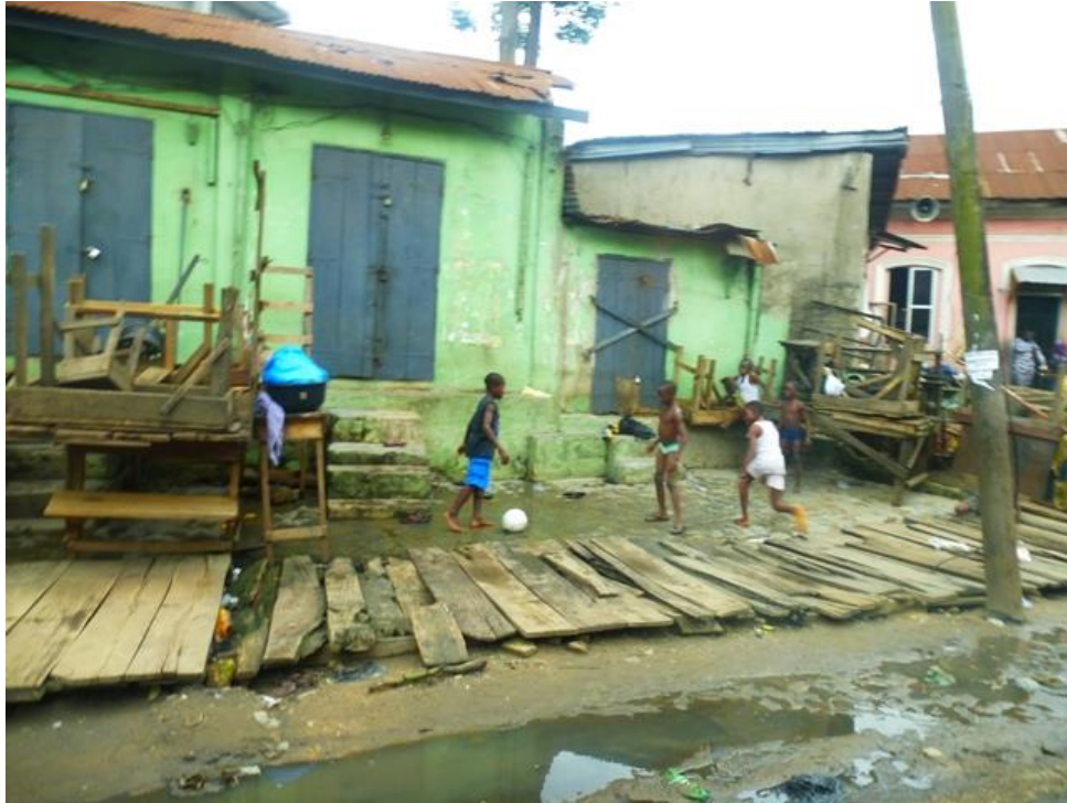
Foto: Futbal v uliciach Lagosu

Pracovny program bol bohaty. Na hlavný event, ktorý sme tam viedli, pozval nás partner aj verejnopravnú televíziu, noviny a rozhlas, takže sme sa objavili v celostátnom vysielaní a v miestnych denníkoch. Bola to pre mňa dosť záťaž, prakticky celý odborný program trvajúci 1,5 dňa bol postavený na mojich prezentáciach. A bohužiaľ klimatizácia v prednáskovej miestnosti nefungovala práve najlepšie...