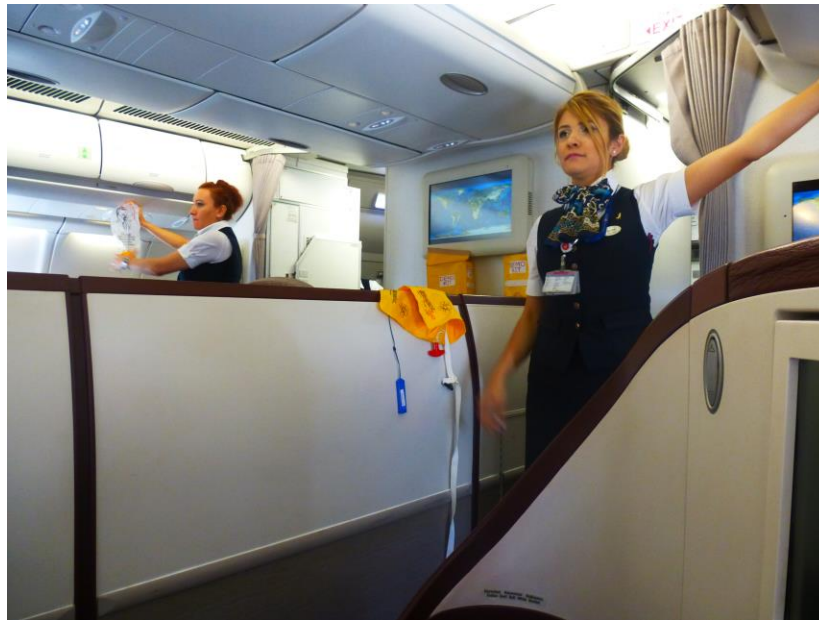
Foto: Na palube Turkish Airlines pri odlete z Lagosu

Celkový dojem z Nigérie bol uspokojivý, až mi ho nakoniec pokazil odchod z krajiny. Situácia na letisku bola podstatne horšia ako pri mojej prvej ceste. Teraz bolo obdobie dažďov a pri teplote cca 30 °C bola takmer 100% vlhkosť. Terminál letiska to nezvladal a vnútri bolo snáď ešte horšie ako vonku. Všade nervozita, plno ľudí, hadky. Mal som „svojho“ sprievodcu, inak neviem ako by som sa cez to prehryzol. Posledný „uradník“ sa ma po pár otázkach na účel môjho pobytu nakoniec otvorene spýtal, že čo mám pre neho. Pochopil som to hneď, lebo som bol na to pripravený, ale kým som si stihol rozmyslieť reakciu, pribehol môj sprievodca a uradník sa stiahol. Samotný boarding bol infarktový, asi zatiaľ môj najhorší zážitok. Nechali nás asi hodinu stať v úzkom koridore, zle vetranom, ľudia takmer kolabovali. Ale nakoniec som domov v poriadku docestoval a ďalší deň som mohol ísť na oslavu otcových 80-tych narodením.