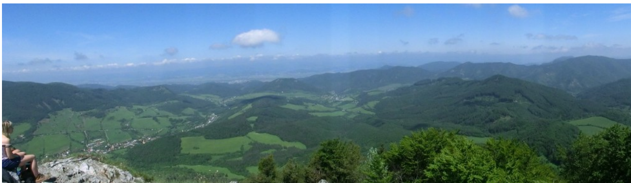
Panoramatický výhľad z Vápča. Pohľad na sever.

Pred sebou máme nádherný slnečný deň, už zrána je pomerne teplo. Za hlavnou cestou križujúcou na trase z Ponitria na Považie členitý terén v okolí masívu Vápča, míňame akúsi turistickú ubytovňu a skupinu detí na školskom výlete, nato krížom cez lúky kráčame k prvému výraznému stúpaniu. Vyštverať sa na strmý zalesnený hrebeň dalo riadnu námahu. Z hrebeňa máme tu a tam výhľad na okolie – mohutné údolie tiahnuce sa k Trenčianskym Tepliciam či naprotivný masív Hoľazneho, a konečne – Vápeč, ktorého špicatý skalnatý vrchol vzbudzuje pri pohľade zdola naozaj rešpekt.