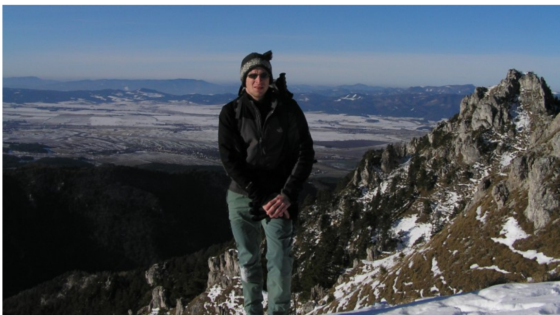
Roland na Zadnej Ostrej. Vpravo špicatý vrchol Ostrej, pod ním Turčianska kotlina, vzadu Malá Fatra.

Vyraziť na túru máme v pláne z obce Blatnica na západnom okraji Veľkej Fatry, do ktorej sme nezavítali už pomere dlho. Auto nechávame pred kaštieľom, ktorý dnes slúži ako múzeum. Vyrážame o ôsmej, od parkoviska smerujeme na okraj obce, k ústiu Gaderskej doliny (508 m.n.m.). Odtiaľ však pokračujeme po zelenej značke inou mohutnou dolinou, Blatnickou. Asfaltová lesná cesta je pokrytá vrstvou nebezpečne klzkého ľadu, kráčame teda dosť opatrne. Zelenú značku, ktorá Blatnickou dolinou pokračuje až ku Kráľovej studni v masíve Krížnej, opúšťame na rázcestí Juriašovo (657 m.n.m., 9:05 hod.). Od tohto bodu výrazne stúpame, žltá značka nás vedie strmou, skalami obklopenou Juriašovou dolinou. Kdesi v jej polovici si dávame prvú pauzu. Raňajky doma sme mali iba veľmi skromné, ozýva sa teda hlad. Po ďalšej hodnej chvíli prudkého stúpania lesom sa vynárame na slnkom zaliatej poľane, pričom zakrátko prichádzame na sedlo Misa (1132 m.n.m., 10:20 hod.). Strmý výšľap nás potom privádza na temeno Zadnej Ostrej (1278 m.n.m., 10:35 hod.). Až na hlavný vrchol masívu Ostrej nepokračujeme, bola by to zachádzka.