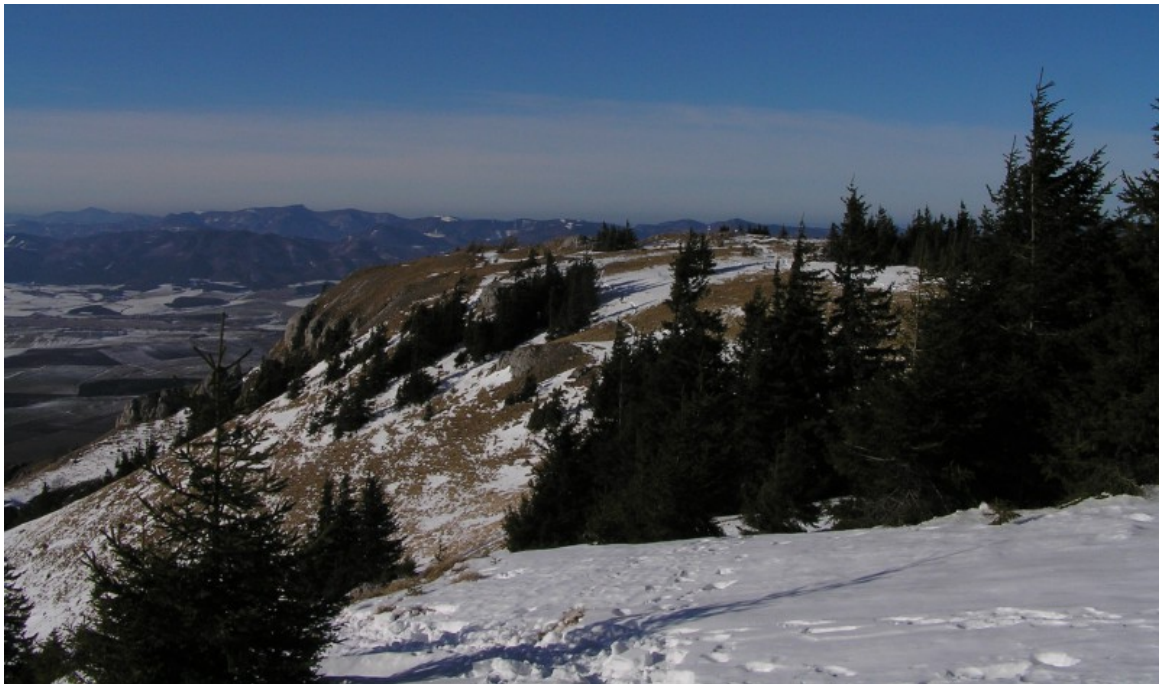
Plochý vrchol Tlstej (1373 m.n.m.).