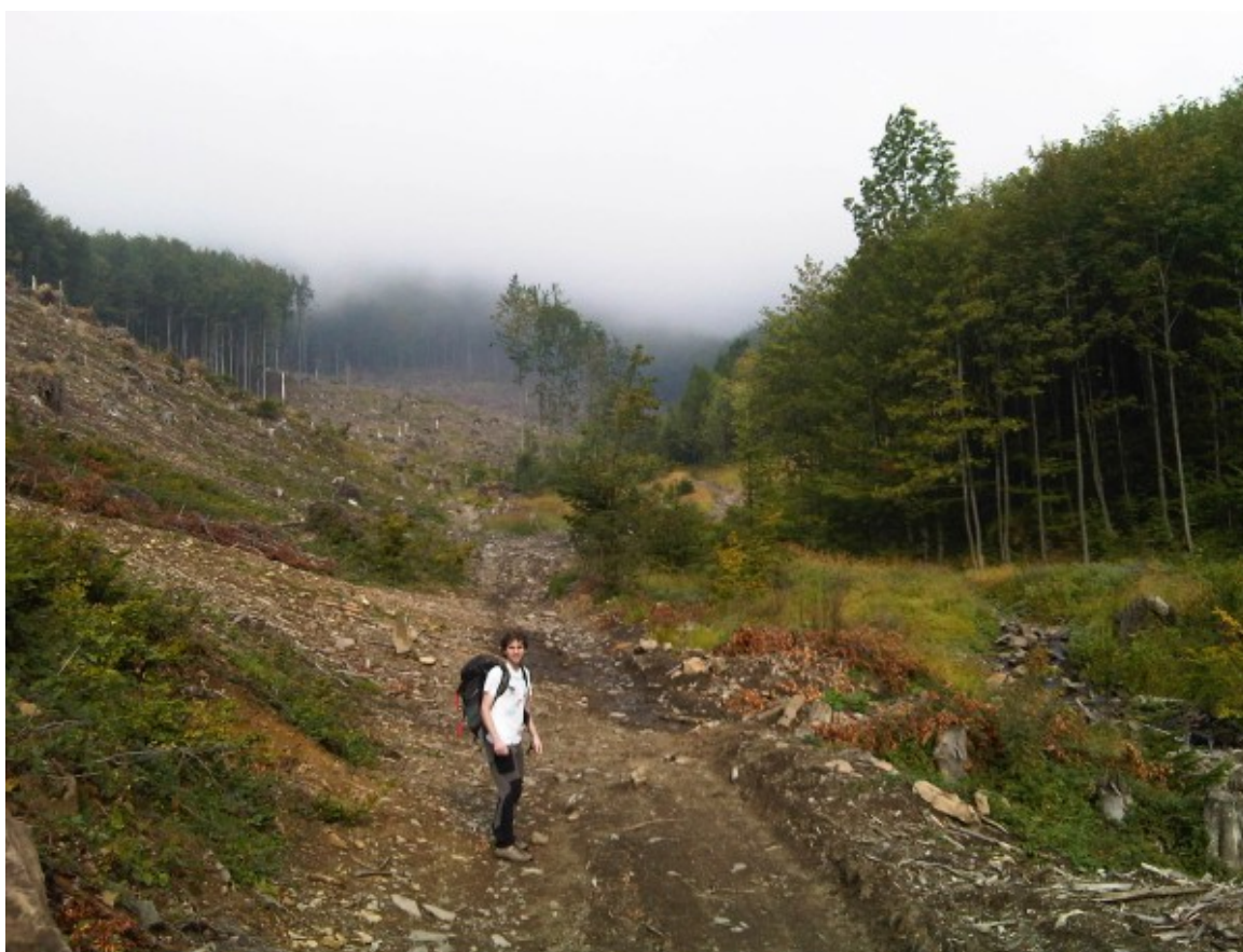
Raňajšie stúpanie rúbaniskom nad Prochotom.